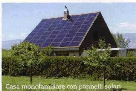
Casa monofamiliare con pannelli solari

■ Ecco tempi e modalità. Anche per il 2009 e il 2010 lo Stato ti incoraggia ad aumentare il risparmio energetico della tua casa, il che include: adozione di pannelli solari termici per la produzione di acqua calda; doppi infissi alle finestre; pannelli isolanti contro le dispersioni di calore. O riqualificazione dell'intero edificio: anche un condominio può avvalersi del bonus per interventi sulle parti comuni . Fino al 31/12/2010 puoi scontare il 55% di queste spese dalle tasse, a patto di documentare ogni lavoro con bonifico bancario o postale. Attenzione: per i lavori compiuti fino al 2008 potevi scegliere di dividere la detrazione dall'Irpef in rate annuali (da 3 a 10), ma da quest'anno potrai chiedere il bonus solo dividendolo in 5 rate annuali (lo scon-